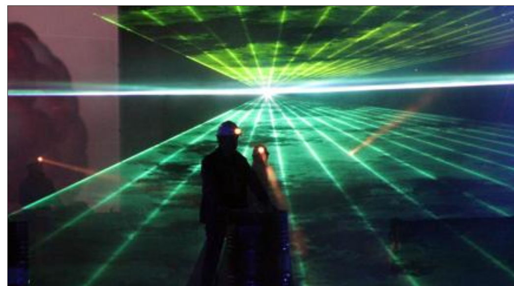
Cette année, l'accent a été mis sur les effets spéciaux avec de nombreux lasers et des moyens pyrotechniques.