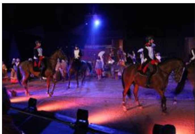
L'arrivée de Napoléon qui avait ordonné une reconnaissance des gisements de charbon.