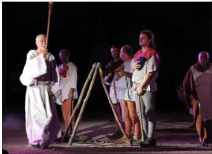
Le pénitent va enflammer le grisou.