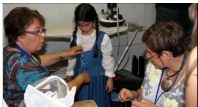
Les costumiers du spectacle ne savent plus où donner de la tête... d'épingle évidemment ! Elles doivent gérer près de 3 000 costumes et autres accessoires. Avant le spectacle, c'est le coup de feu car de nombreux figurants ont toujours un petit "problème" à régler. « Nous travaillons toute l'année sur les costumes, surtout les mercredis après-midi dans le cadre d'un atelier », explique une costumière bénévole.