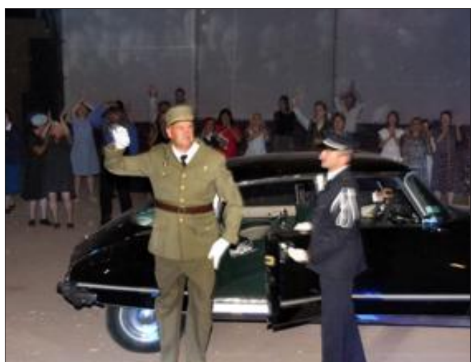
De Gaulle et la nationalisation des mines.

Les Enfants du charbon donneront les trois dernières représentations de leur spectacle les 25, 26 et 27 août à Petite-Rosselle. Deux heures de son et lumière sur l'épopée minière. À ne pas manquer.