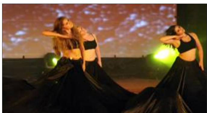
Le charbon, représenté par une chorégraphie signée Michèle Meftah.