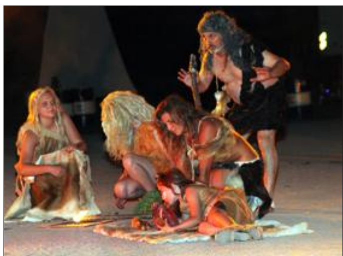
La découverte du feu, un moment important pour l'Homme.